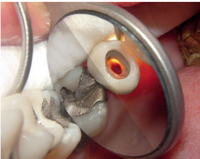
Abb. 1: Die Spiegeloberfläche des Standardmundspiegels mit \varnothing 22 mm (ULTRA FS bright) weist eine bis zu 40% höhere Lichtreflexion gegenüber Standardspiegeln mit Rhodium auf.

Diesen Feststellungen kann ich uneingeschränkt zustimmen, da in meiner Praxis ULTRA helle Mundspiegel verwendet werden ( Abb. 1 ), um ein effektives und möglichst auch effizientes Vorgehen unter „klaren“ Sichtverhältnissen zu ermöglichen. Hierbei kommen nicht nur Standardgrößen zum Einsatz, sondern auch Mikrospiegel in ausgewählt kleineren Formaten ( Abb. 2 ).