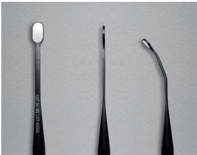
Abb. 4: V.l.n.r.: Das plane Schaftende gewährleistet eine solide Stabilität des Instrumentes; ein gezieltes und mehrfaches Biegen bis kurz vor den Spiegelkopf ist möglich; jedoch verringert sich die Flexibilität materialbedingt durch ein häufiges Biegen (Prinzip der Kaltverfestigung).