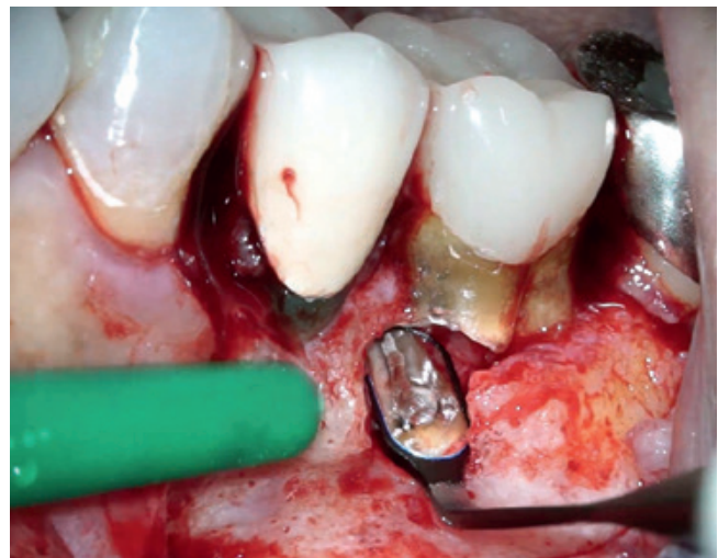
Abb. 5: Besonders in diffizilen Diagnostik- oder Behandlungssituationen leisten die Mikrospiegel hilfreiche Dienste. Zu beachten ist der manuell abgewinkelte Spiegelschaft; dies ist nur mit diesen speziellen Instrumenten aus der MICROflex-Produktreihe möglich.