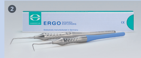
2 ERGOtouch Sonden, einseitig (permanent montiert)