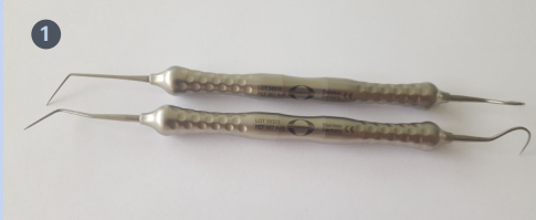
1 ERGOtouch duo Sonden (permanent montiert)