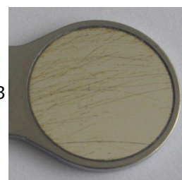
Slika 3 Praske/sledi čiščenja

MEGA FS Rhodium, Saphir FS Rhodium Rodij učinkuje kot premaz proti sprijemanju. Ker je žlahtna kovina, kot zlato, je odporen proti kislinam . V kombinaciji s protisprjemalnim učinkom je zato mogoče ostanki vodnega kamna enostavno odstraniti s čistili, ki vsebujejo kislino (npr. Neodisher N).