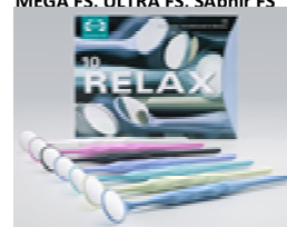
Slika 2 RELAX