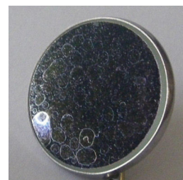
Slika 4 Madeži vodnega kamna