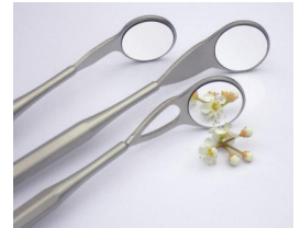
Εικόνα 1 MEGA FS, ULTRA FS, Saphir FS

Και στην περίπτωση αυτού του καθρέπτη στόματος πρέπει να προσέχετε τα προστατευτικά μέτρα για τον τυχόν υπολειπόμενο κίνδυνο θραύσης γυαλιού.