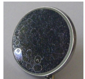
Εικόνα 4 Λεκέδες άσβεστου