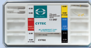
REF 43 610