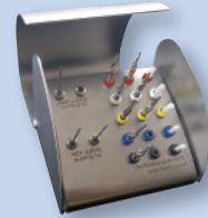
REF 10 001