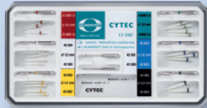
REF 43 600