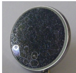
Bild 4 kalkfläckar