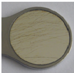
Bild 3 repor/putsränder

Rhodium fungerar som en nonstick-beläggning. Rhodium i egenskap av ädelmetall, precis som guld, är syrafast. I kombination med nonstick-effekten kan kalkhaltiga rester avlägsnas enkelt med syrahaltiga rengöringsmedel (t.ex. Neodisher N).