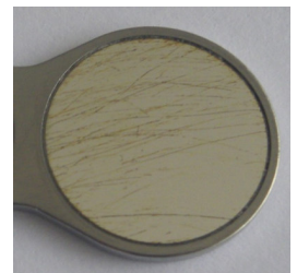
Bild 3 repor/putsränder

Vårt tips: MEGA FS Rhodium, Saphir FS Rhodium Rhodium fungerar som en nonstick-beläggning. Rhodium i egenskap av ädelmetall, precis som guld, är syrafast . I kombination med nonstick-effekten kan kalkhaltiga rester avlägsnas enkelt med syrahaltiga rengöringsmedel (t.ex. Neodisher N).