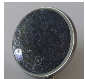
Bild 4 kalkfläckar