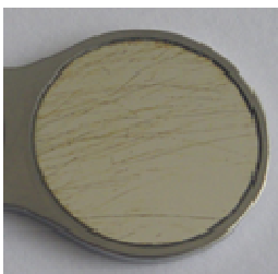
3 attēls. Skrāpējumi/tīrīšanas švīkas

Rodijs darbojas kā pārklājums, kas novērš pielipšanu. Rodijs ir cēlmetāls tāpat kā zelts, un tas ir izturīgs pret skābēm . Kombinācijā ar pretpielīpes efektu kaļķainās atliekas ar skābi saturošu tīrītāju (piem., Neodisher N) var vienkārši notīrīt.