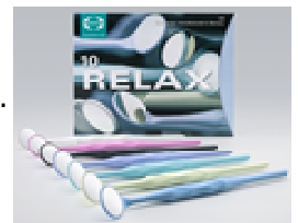
Slika 2 RELAX