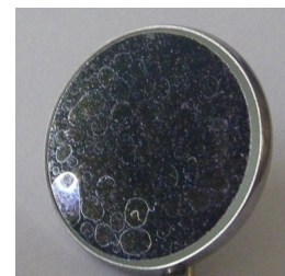
Obr. 4 Skvrny od vápna