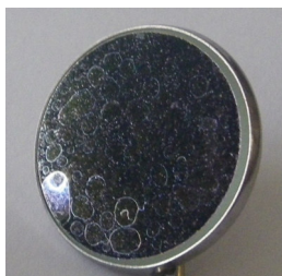
Obr. 4 Vápenaté skvrny