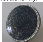
фиг. 4 Петна от варовик