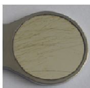
фиг. 3 Надрасквания/следи от почистване

Родият действа като противозалепващо покритие. Родият е благороден метал като златото и е устойчив на киселини. Затова в комбинация с противозалепващото покритие варовиковите отлагания могат да бъдат отстранени лесно със съдържащ киселина почистващ препарат (напр. Neodisher N).