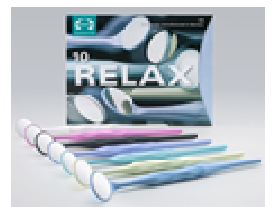
Bilde 2 RELAX