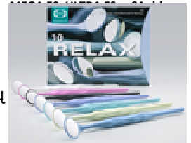
2 paveikslėlis. RELAX.