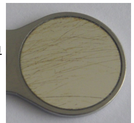
3 paveikslėlis. Įbrėžimai, valymo režiai.

Mūsų patarimas: „MEGA FS Rhodium“, „Saphir FS Rhodium“ Rodis veikia kaip sukibimą mažinanti danga. Rodis kaip taurasis metalas yra atsparus rūgštims kaip ir auksas. Todėl kartu esant sukibimą mažinančiam poveikiui kalkių nuosėdas galima paprastai pašalinti rūgštiniu valikliu (pvz., „Neodisher N“).