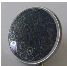
Photo 4 Taches de calcaire