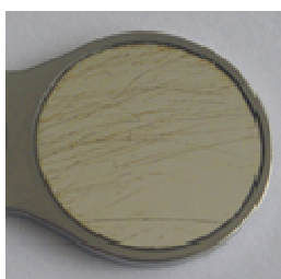
Photo 3 Rayures/stries de nettoyage

Le rhodium agit comme une couche antiadhésive. Le rhodium est en tant que métal précieux pareil à l'or résistant aux acides. En association avec l'action antiadhésive il est donc possible de retirer des résidus calcaires simplement en appliquant des nettoyeurs contenant des acides (par ex. Neodisher N).