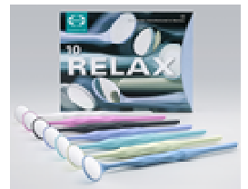
Photo 2 RELAX