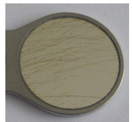
Photo 3 Rayures/stries de nettoyage

SEplus, Economy (Rear Surface Mirrors - miroirs à surface arrière) ULTRA FS, ULTRAVision FS (Front Surface Mirrors – miroirs à surface avant)