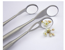
Photo 1 MEGA FS, ULTRA FS, SAphir FS

Veillez à respecter les mesures de précaution en raison du risque de restes de bris de verre du miroir buccal.