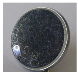
Photo 4 Taches de calcaire