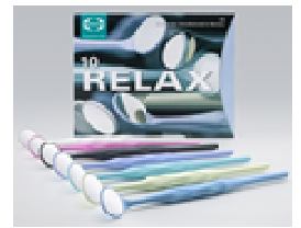
Εικόνα 2 RELAX

Είναι ενδεχομένως σκόπιμο να απομακρύνετε κομμάτια του καθρέπτη με τη χρήση κατάλληλων βοηθημάτων, όπως π.χ. τσιμπίδα, αναρροφητής. Προσέξτε κατά τη διάρκεια αυτής της διαδικασίας την κατάλληλη προστασία από τα γυαλιά, για να αποφύγετε κίνδυνο τραυματισμού ή λοίμωξης.