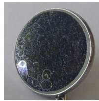
Εικόνα 4 Λεκέδες άσβεστου