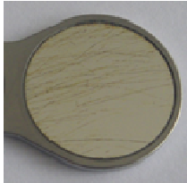
Εικόνα 3 Γρατσουιές/λωρίδες από καθαρίσιμα

Το ρόδιο δρα ως αντικολλητική επικάλυψη. Ως ευγενές μέταλλο το ρόδιο είναι – όπως και ο χρυσός – ανθεκτικό στα οξέα. Σε συνδυασμό με την αντικολλητική δράση μπορούν έτσι να απομακρυνθούν εύκολα κατάλοιπα αλάτων με τη βοήθεια όξινων καθαριστικών (π.χ. Neodisher N).