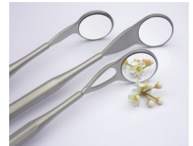
Εικόνα 1 MEGA FS, ULTRA FS, Saphir FS

Για αυτόν τον λόγο να λαμβάνεται προληπτικά μέτρα , ιδίως στην περίπτωση παιδιών και κρίσιμων ασθενών. Παραδείγματος χάρη με τη βοήθεια ενός ελαστικού απομονωτήρα ή απορροφητή σάλιου, που αποτρέπει το δάγκωμα.