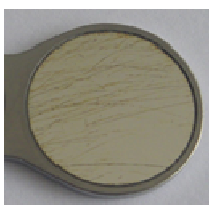
Εικόνα 3 Γρατσουνιές/λωρίδες από καθάρισμα

Το ρόδιο δρα ως αντικολλητική επικάλυψη. Ως ευγενές μέταλλο το ρόδιο είναι – όπως και ο χρυσός – ανθεκτικό στα οξέα. Σε συνδυασμό με την αντικολλητική δράση μπορούν έτσι να απομακρυνθούν εύκολα κατάλοιπα αλάτων με τη βοήθεια όξινων καθαριστικών (π.χ. Neodisher N).