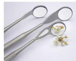
Fig. 1 MEGA FS, ULTRA FS, Saphir FS

Osservare, per questo specchietto orale, anche le misure precauzionali relative a un rischio residuo di rottura del vetro.