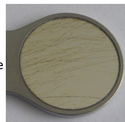
Fig. 3 Graffi / striature

Il rodio agisce da rivestimento antiaderente. Il rodio è un metallo nobile resistente agli acidi come l'oro. Grazie a questa azione antiaderente è possibile rimuovere facilmente i residui di calcare con un detergente acido (per es. Neodisher N).