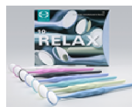
Fig. 2 RELAX