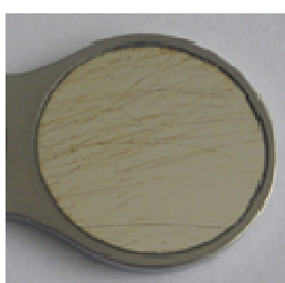
Fig. 3 Graffi / striature

Il rodio agisce da rivestimento antiaderente . Il rodio è un metallo nobile resistente agli acidi come l'oro. Grazie a questa azione antiaderente è possibile rimuovere facilmente i residui di calcare con un detergente acido (per es. Neodisher N).